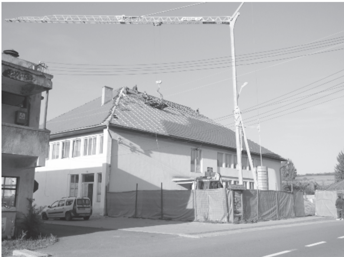
A kultúrotthonon dolgoznak, de csak jövőben fejezik be